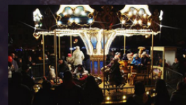
Urząd Miejski w Brzesku - BRZESKO