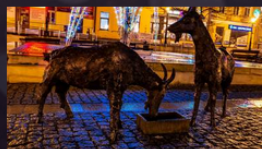
Urząd Miejski w Brzesku - BRZESKO