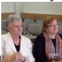
width="100"] KODAK Digital Still Camera[/caption][caption id="attachment_73171"