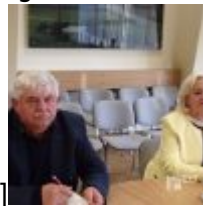
id="attachment_73167" align="alignnone" width="100"] KODAK Digital Still