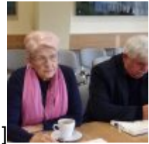
Camera[/caption][caption id="attachment_73168" align="alignnone" width="100"] KODAK Digital Still Camera[/caption][caption id="attachment_73169" align="alignnone" width="100"]