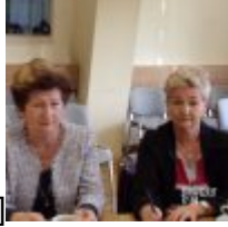
align="alignnone" width="100"] KODAK Digital Still Camera[/caption][caption