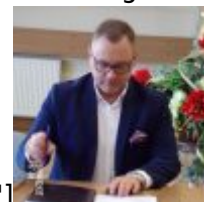
Camera[/caption][caption id="attachment_73163" align="alignnone" width="100"] KODAK Digital Still Camera[/caption][caption id="attachment_73164" align="alignnone" width="100"]