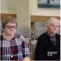
KODAK Digital Still Camera[/caption][caption id="attachment_73170" align="alignnone"