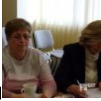
width="100"] KODAK Digital Still Camera[/caption][caption id="attachment_73166"