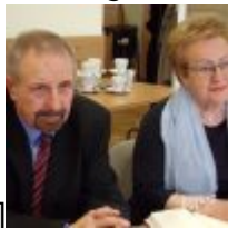
align="alignnone" width="100"] KODAK Digital Still Camera[/caption][caption