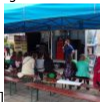
id="attachment_51905" align="alignnone" width="100"] KODAK Digital Still