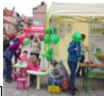
align="alignnone" width="100"] KODAK Digital Still Camera[/caption][caption