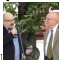
id="attachment_51914" align="alignnone" width="100"] KODAK Digital Still