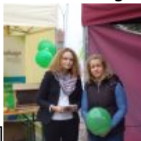
width="100"] KODAK Digital Still Camera[/caption][caption id="attachment_51904"