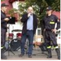
KODAK Digital Still Camera[/caption][caption id="attachment_51917" align="alignnone"