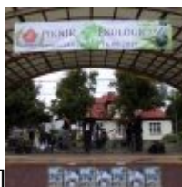
[caption id="attachment_51900" align="alignnone" width="100"] KODAK Digital Still

Piknik uatrakcyjniła „Biesiada poniekąd ekologiczna” prezentowana przez grupę „Sprawa Drugorzędna” działającą przy MOK w Brzesku. Obecni na pikniku mogli bezpłatnie zaopatrzyć się w sadzonki drzew - lipy, jesiony, jodły, sosny i modrzewie dostarczone przez nadleśnictwo Brzesko oraz częstować się ekologicznymi jabłkami.