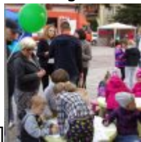
align="alignnone" width="100"] KODAK Digital Still Camera[/caption]