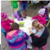
width="100"] KODAK Digital Still Camera[/caption][caption id="attachment_51918"