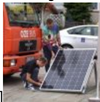
align="alignnone" width="100"] KODAK Digital Still Camera[/caption][caption