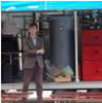
width="100"] KODAK Digital Still Camera[/caption][caption id="attachment_51909"