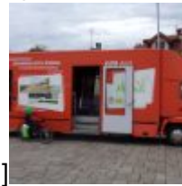
id="attachment_51910" align="alignnone" width="100"] KODAK Digital Still