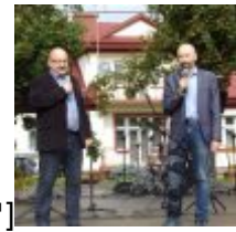
Camera[/caption][caption id="attachment_51915" align="alignnone" width="100"] KODAK Digital Still Camera[/caption][caption id="attachment_51916" align="alignnone" width="100"]