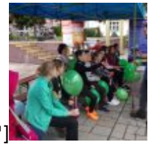
Camera[/caption][caption id="attachment_51906" align="alignnone" width="100"] KODAK Digital Still Camera[/caption][caption id="attachment_51907" align="alignnone" width="100"]