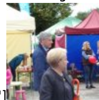
Camera[/caption][caption id="attachment_51901" align="alignnone" width="100"] KODAK Digital Still Camera[/caption][caption id="attachment_51902" align="alignnone" width="100"]