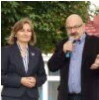
width="100"] KODAK Digital Still Camera[/caption][caption id="attachment_51913"