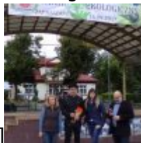
align="alignnone" width="100"] KODAK Digital Still Camera[/caption][caption