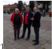
Camera[/caption][caption id="attachment_51911" align="alignnone" width="100"] KODAK Digital Still Camera[/caption]KODAK Digital Still Camera[caption id="attachment_52255" align="alignnone"