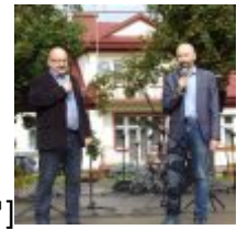
Camera[/caption][caption id="attachment_51915" align="alignnone" width="100"] KODAK Digital Still Camera[/caption][caption id="attachment_51916" align="alignnone" width="100"]