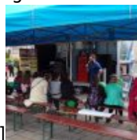
id="attachment_51905" align="alignnone" width="100"] KODAK Digital Still