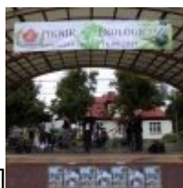
[caption id="attachment_51900" align="alignnone" width="100"] KODAK Digital Still

Piknik uatrakcyjniła „Biesiada poniekąd ekologiczna” prezentowana przez grupę „Sprawa Drugorzędna” działającą przy MOK w Brzesku. Obecni na pikniku mogli bezpłatnie zaopatrzyć się w sadzonki drzew - lipy, jesiony, jodły, sosny i modrzewie dostarczone przez nadleśnictwo Brzesko oraz częstować się ekologicznymi jabłkami.