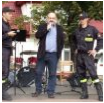
KODAK Digital Still Camera[/caption][caption id="attachment_51917" align="alignnone"