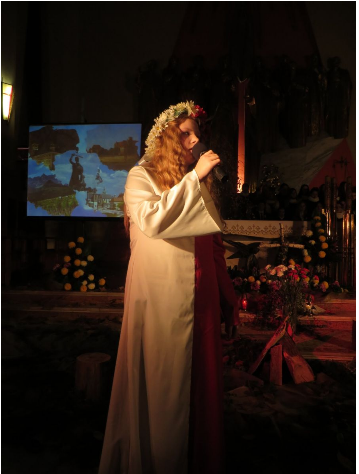
W wigilię Narodowego Święta Niepodległości w brzeskiej farze odbyła się wieczornica – uroczystość religijno – patriotyczna, która realizowała jeden z punktów programu obchodów 11 Listopada w naszym mieście. Przygotowali ją po raz jedenasty uczniowie i nauczyciele z Publicznego Gimnazjum nr 1 im. Królowej Jadwigi